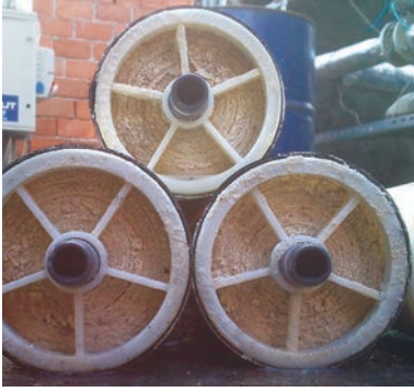
Taş önlere dozlanmadan kullanılmış T.O. membranları

ham su içinde, örneğin 2000 birim (mg/L) bulunan mineraller (iyonlar), ters ozmoz cihazının ürettiği su içinde 50-60 birime düşerken, ters ozmoz cihazının attığı su içindeki mineraller 8000 birim (mg/L) seviyelerine yükselir. Oysa suyun sıcaklığına, pH derecesine ve içinde bulundurduğu toplam mineral miktarına göre suyun “çözünmüş” olarak, yani iyon olarak içinde barındıracağı mineral miktarı sınırlıdır. Bu sınırın üzerine çıkan mineraller ters ozmoz membranları içinde kristalleşerek taş oluşturur ve membranların su geçirme yeteneğini bozar ve sonunda sistem TIKANIR!.. İşte bu sebeple, ters ozmoz sistemi besli suyu içine “taş önlere” kimyasalı verilir. Üstteki resimde, “taş önlere” dozlanması ihmal edilmiş bir sistemde kullanılan membranlar görünüyor.